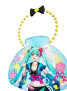
有料エリア 入場パス

【販売URL】： https://seed.online/products/07ae305320780e33400a9d7fc7db817f20d8a80990d5e903641e557b62223735