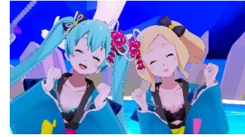
Art by 五十嵐拓也

毎回多くの来場者で賑わうキャラクターグリーティングは、8月27日（金）～8月30日（月）の19時00分～23時00分、ゲート広場で複数回実施します。PC版バーチャルキャストでは、初音ミク、巡音ルカ、鏡音レン、鏡音リン、ときのそら、GEMS COMPANY、ミクダヨー、ラビット・ユキネが、Quest版バーチャルキャストでは初音ミクと東雲めぐが登場します。なお、Quest版バーチャルキャストのグリーティングは事前申込が必要になります。