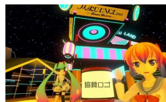
企業名・ユーザー名入りの提灯を展示予定

また、個人サポーターに応募したユーザーには、個人サポーター限定のバーチャルアイテム「ミクランド特製打ち上げ花火」（11,000VCC）を販売します。本アイテムは購入特典として、自身の名前入り提灯が会場内に設置されるほか、先着300名には初音ミクのぬいぐるみがプレゼントされます。