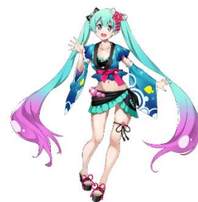
「初音ミク SUMMER VACATION 2021 ver.」 イラスト：Gugenka所属 CGアーティスト 五十嵐拓也

【MIKU LAND公式Twitter】 https://twitter.com/Mikuland_info