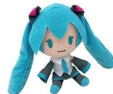
個人サポーター特典「ミクぬいぐるみ」